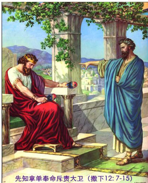
先知拿单奉命斥责大卫（撒下12: 7-15）

大卫跟拔示巴犯了淫乱罪，大卫快乐了一阵子。但是要记住，罪的舒畅不过是一时的，罪的后果却会回头来缠住你。大卫和拔示巴有